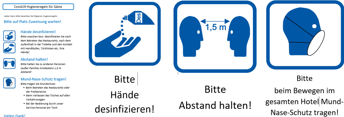
Abb. 1 Aushänge und Informationen für Gäste (Auswahl)